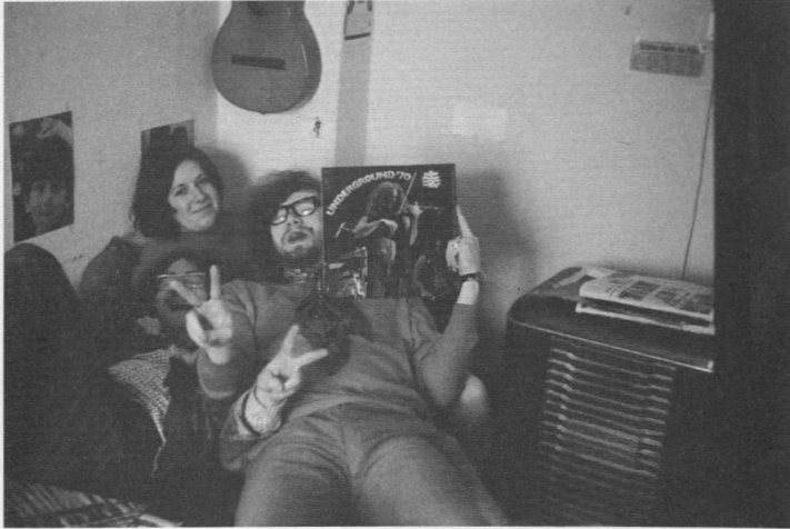
Gymnasiasten aus dem Bayerischen Neuendettelsau und Windsbach hören Musik, um 1970.