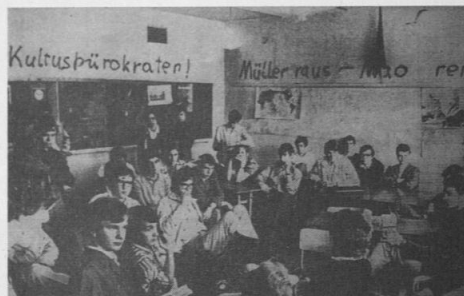
Frankfurter Schüler 1969 beim „Selbstunterricht“ ohne Lehrkräfte.