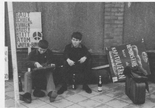
Frankfurter Schüler ruhen sich nach einer Demonstration gegen Atomwaffen 1967 aus.

Haben Sie Ende der 1960er-Jahre eine Schule in Frankfurt besucht? Wie haben Sie die Stimmung in der Stadt und an Ihrer Schule erlebt? Haben Sie sich vielleicht sogar selbst aktiv an den Protesten beteiligt, den Unterricht verweigert, an Demonstrationen teilgenommen oder Flugblätter verteilt? Ihre persönlichen Schüler-Geschichten und Erinnerungs-Objekte (Fotos, Flugblätter, Plakate, etc.) nehmen wir in die Ausstellung auf! Schicken Sie uns ein Foto mit einem kurzen Erläuterungstext (300 Zeichen) per E-Mail an a.spieker@mspt.de oder per Post an Museum für Kommunikation, Museumspädagogik, Nina Voborsky, Schaumainkai 53, 60596 Frankfurt am Main