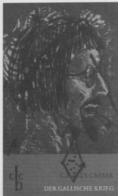
Der Gallische Krieg von Gaius Julius Caesar, 1968 von Schülerhand verziert. Schulgeschichtliche Sammlung Nürnberg