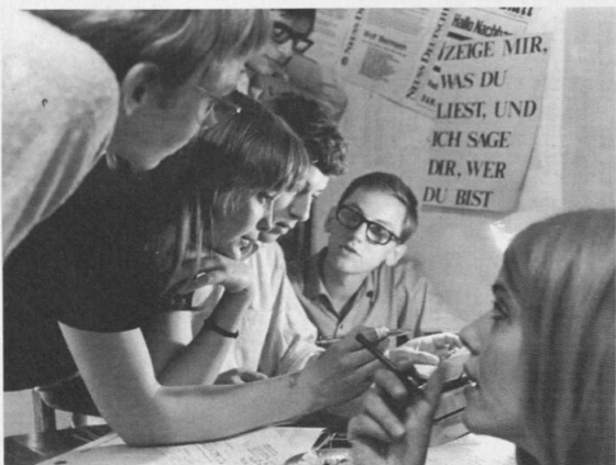
Redaktionssitzung der Berliner Schülerzeitung „Neuer Roter Turm“ 1967. Haus der Geschichte der Bundesrepublik Deutschland Bonn

Die Präsentation im Museum für Kommunikation verbindet eine klassische Ausstellung mit einem Lernlabor. Hier können sich Schülerinnen und Schüler, aber auch erwachsene Besucherinnen und Besucher nach eigenem Interesse mit den Themen beschäftigen oder sich mit anderen darüber austauschen. Anhand zahlreicher Objekte wie Tagebücher, Flugblätter, Fotografien, Schülerzeitungen oder Schulhefte blickt die Ausstellung in die Klassenzimmer von damals. Zeitzeugenberichte ergänzen diese Perspektive.